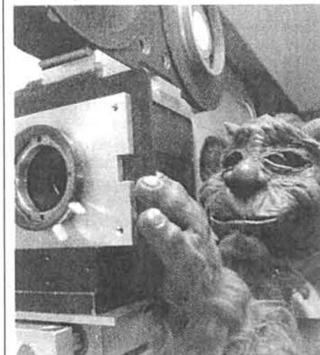
Special Effects in Babelsberg.

So kann man zum Beispiel einen Blick auf die Kulissen von Fritz Lang im Tagebau Rüdersdorf/Woltersdorf werfen. Dort werden im August Filme und Filmmusiken der 20er und 30er Jahre aufgeführt. Im Spreewald stand seinerzeit Asta Nielsen in dem Film „Der fremde Vogel“ vor der Kamera – und wurde zum Star. Ihr und anderen Filmgrößen wie zum Beispiel Camilla Horn, die im Spreewald wohnte, widmet das Museum Lübben ab Juni die Sonder-schau „Verliebt in die Liebe“. Und wer wissen möchte, „wo die Bilder laufen lernten“, der begibt sich auf Entdeckungstour in verborgene Lichtspielhäuser und ehrwürdige Kinos in den Städten mit historischen Stadtkernen.