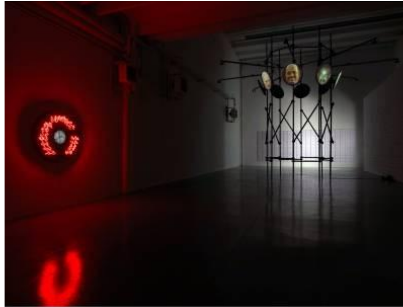
Vista della mostra presso dispari&dispari project reggio emilia

Un tempo che almeno in questo caso viene distrutto con i suoi miti, reso puramente dato fattuale di una condizione del nostro essere qui ed ora, risultato di una concatenazione di valori che hanno reso la temporalità merce di scambio e bene primario destinato a limitare o meno la vita umana.