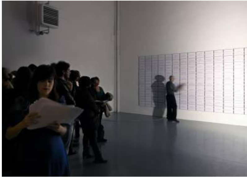
Immagine della Performance inaugurata